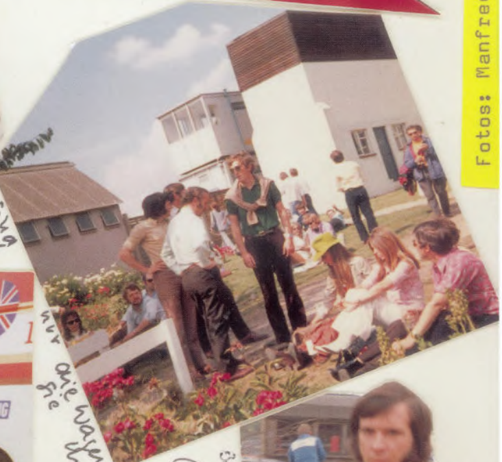
No 519 habe ich

Brands Hatch 1970