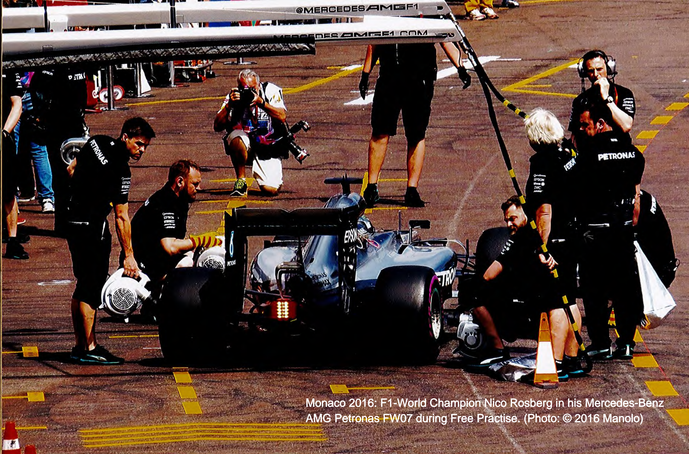
Monaco 2016: F1-World Champion Nico Rosberg in his Mercedes-Benz AMG Petronas FW07 during Free Practise.