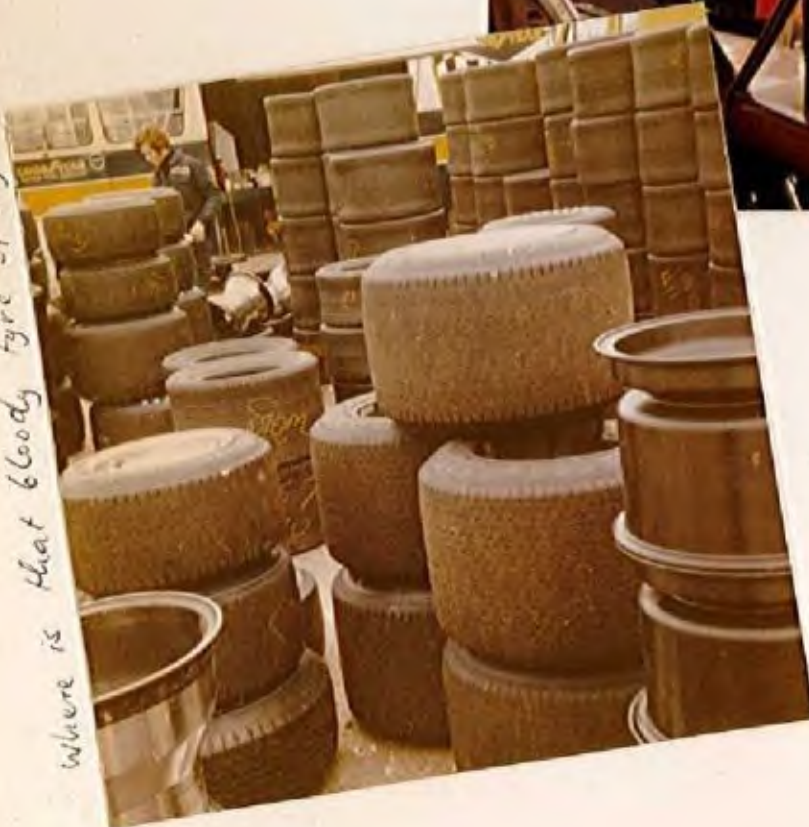
Goodyear F1-tyres (Brands Hatch 1970)