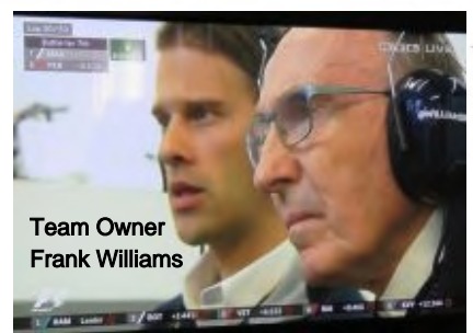
Team Owner Frank Williams