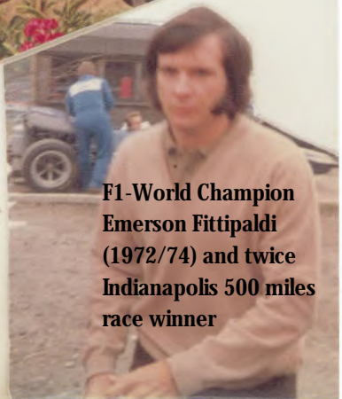
F1-World Champion Emerson Fittipaldi (1972/74) and twice Indianapolis 500 miles race winner