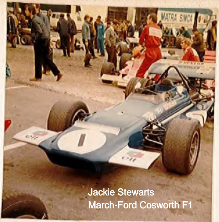
Jackie Stewart March-Ford Cosworth F1