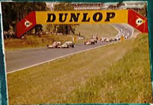
Brands Hatch 1970: F1- British Grand Prix (Druids Corner - Ickx-Ferrari, Brabham-Brabham, Rindt-Lotus and the rest of the field)